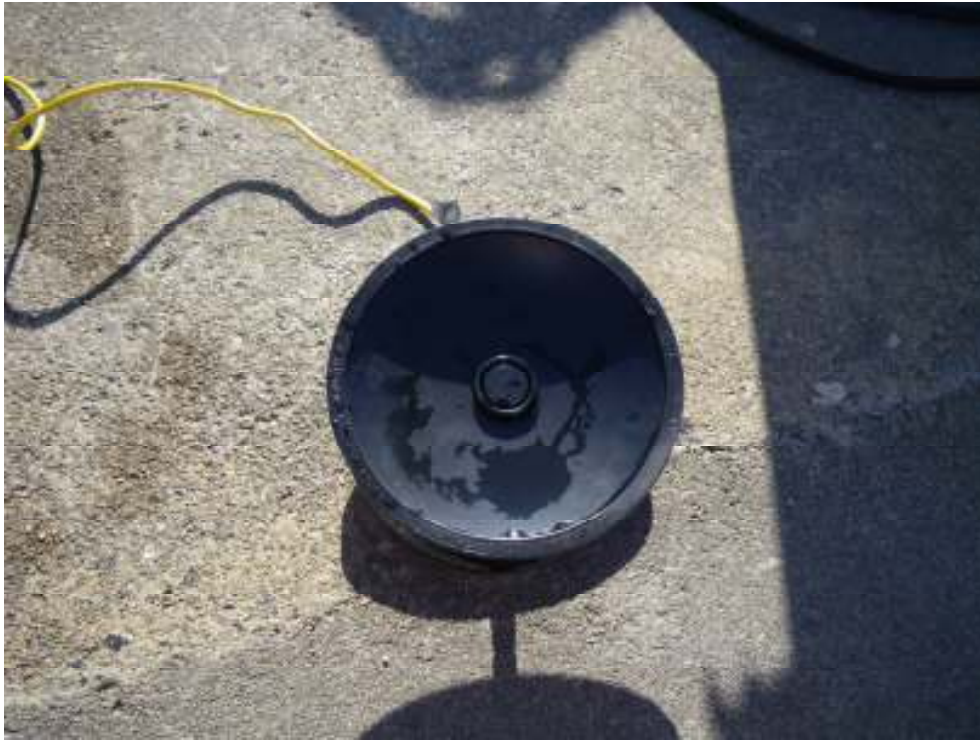
Lubel undervann høyttaler