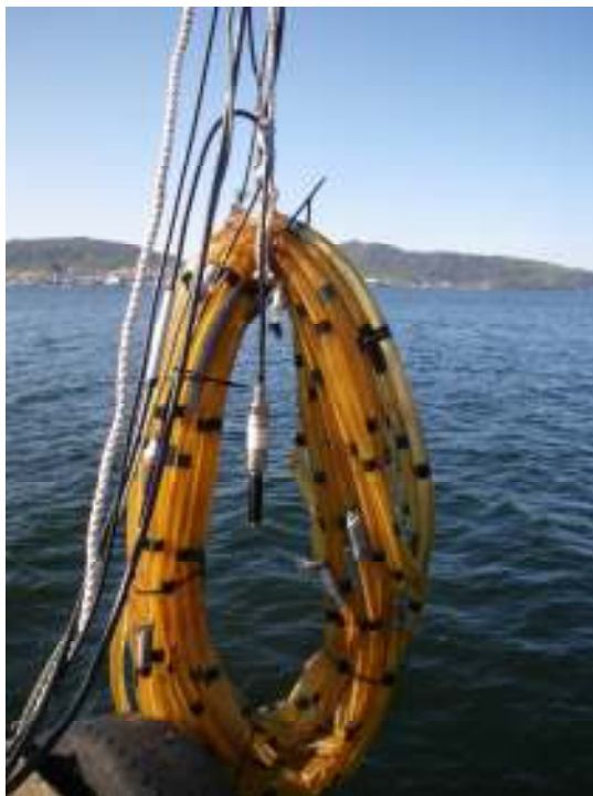
Streamer og referansehydrofon før senking i sjøen